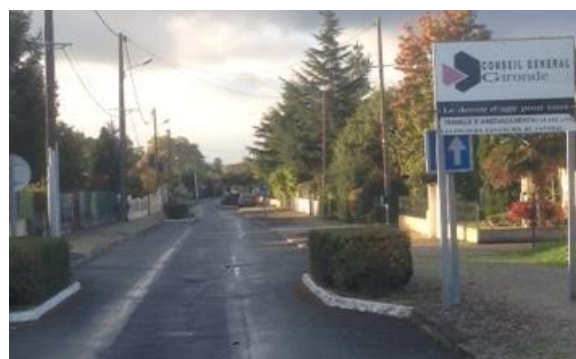
Rue du Roux