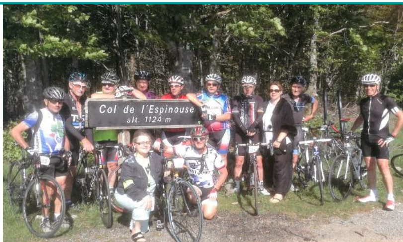
Les membres de l'association

Confirmé comme débutant nous aurons toujours une place pour vous accueillir.