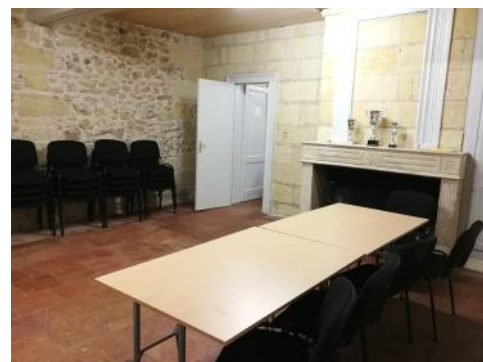
Maison des Associations (Salle)