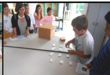
Photos des élections des délégués de classes