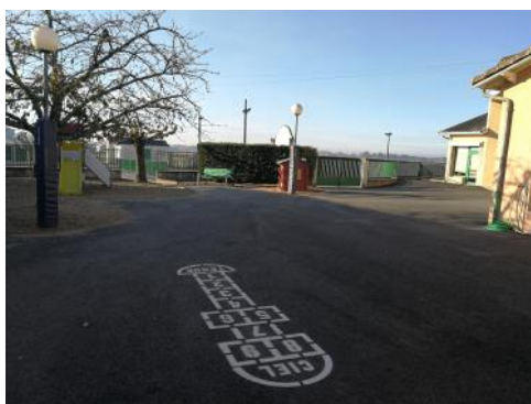
Cour école Maternelle