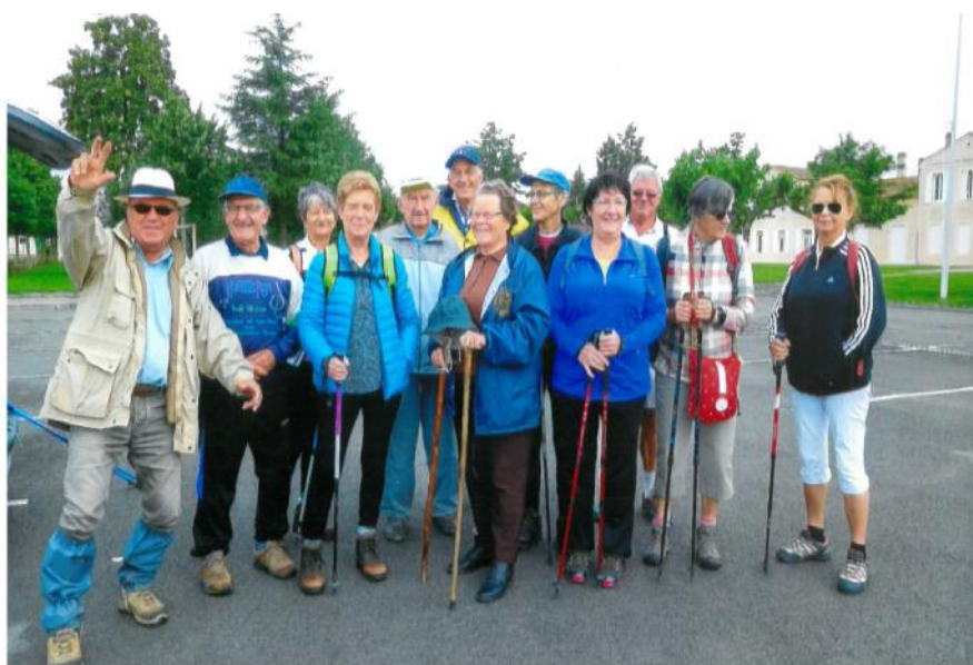
Les membres de l'association

Parmi les nombreuses activités de l'association «Amitié et Loisirs», (belote, scrabble, pétanque, peinture sur porcelaine, loto mensuel avec goûter ) il en est une qui perdure depuis de nombreuses années, il s'agit de la marche.